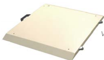
Verplaatsbaar d.m.v. wielen en handgreep